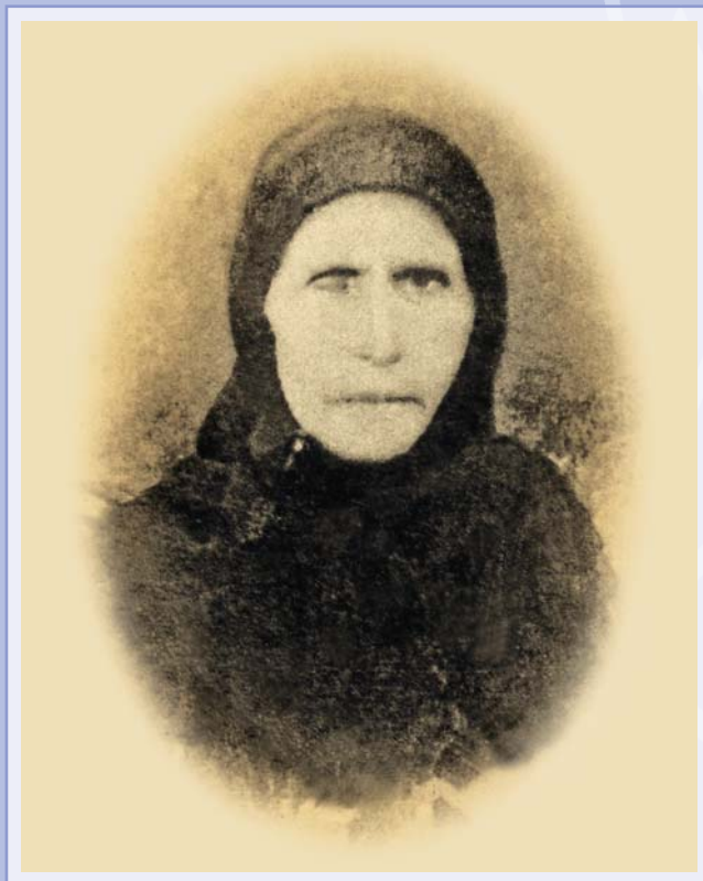
Η ηρωίδα Ελένη Στάικου σε μεγάλη ηλικία

Τις ηρωικές εκείνες ώρες η Ειρήνη Στασινοπούλου, γιαγιά του ιστορικού Κωνσταντίνου Στασινοπούλου, δαγκώνει τη γλώσσα της για να πεθάνει από αιμορραγία. Και του Βραχωρίτη οπλαρχηγού Ζαχαράκη Στάικου η εικοσάχρονη κόρη, η όμορφη Ελένη, για να αποφύγει την ατίμωση αυτοτραυματίζεται βγάζοντας το μάτι της. Αιχμαλωτίζεται, μα το 1829 επιστρέφει στο Μεσολόγγι ενώ το 1832 μετοικεί στο Βραχώρι (Αγρίνιο). Εξάλληλου, το περίτεχνο γιλέκο που φορούσε στην Έξοδο φιλοξενείται στο Κέντρο Λόγου και Τέχνης ΔΙΕΞΟΔΟΣ – Ιστορικό Μουσείο , στο Μεσολόγγι.