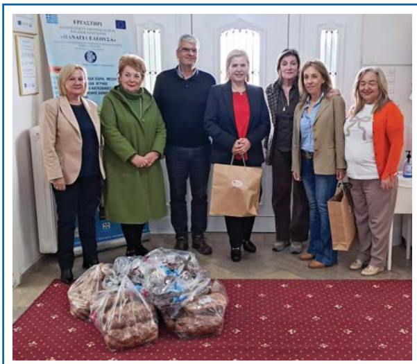
11-4-2025. Αντιπροσωπεία της Αντιπεριφέρειας Αρχής Κοινωνικής Πολιτικής και Οικογένειας επισκέπτεται τη Α' Εκπαιδευτική Μονάδα στο Μεσολόγγι.