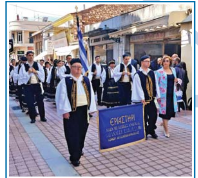
Εορτές Εξόδου 2025 στο Μεσολόγγι