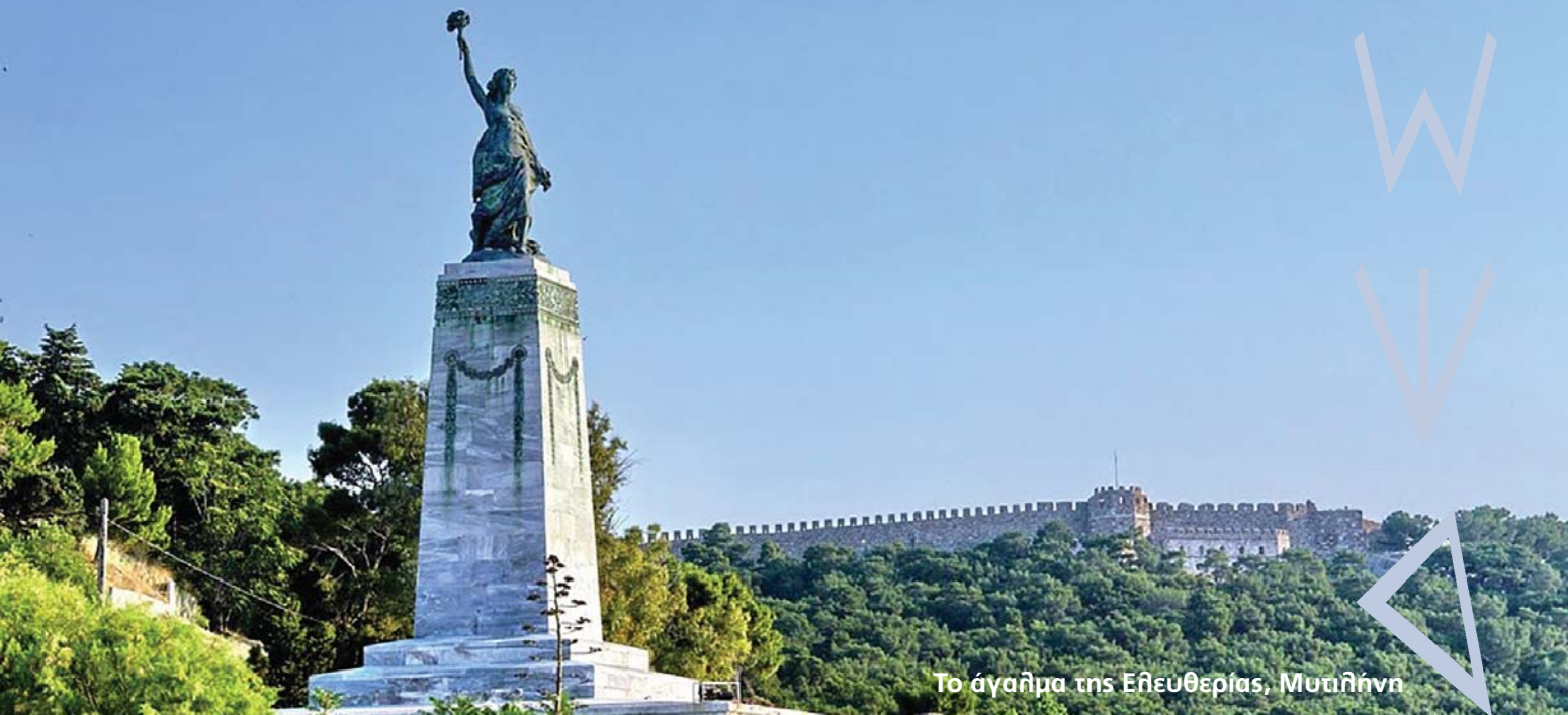
Το άγαλμα της Ελευθερίας, Μυτιλήνη

ηλιά και με φιλοσοφίες. «Δώρημα τέλειον άνωθεν καταβαίνον εκ του πατρός των φώτων». Φλόγα άπιαστη, ακατανόητη πνοή!