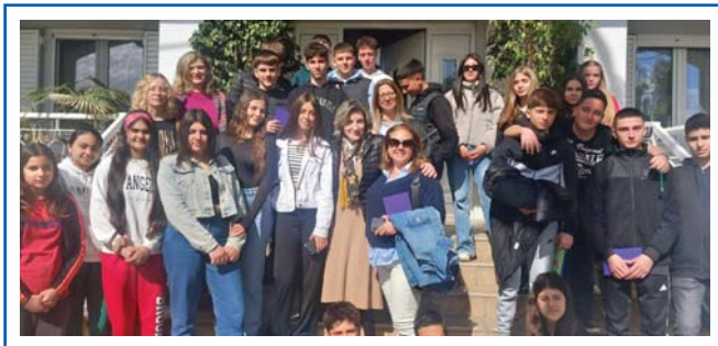
Το Γυμνάσιο Αιτωλικού επισκέπτεται το Εκπαιδευτικό μας Κέντρο στο Μεσολόγγι στις 2-4-2025.