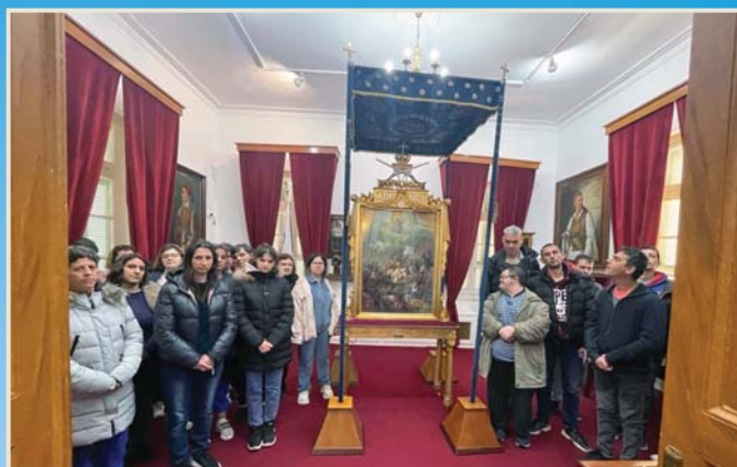
8-4-2025. Επιμορφωτική επίσκεψη των νέων μας στην Πινακοθήκη Μεσολογγίου.