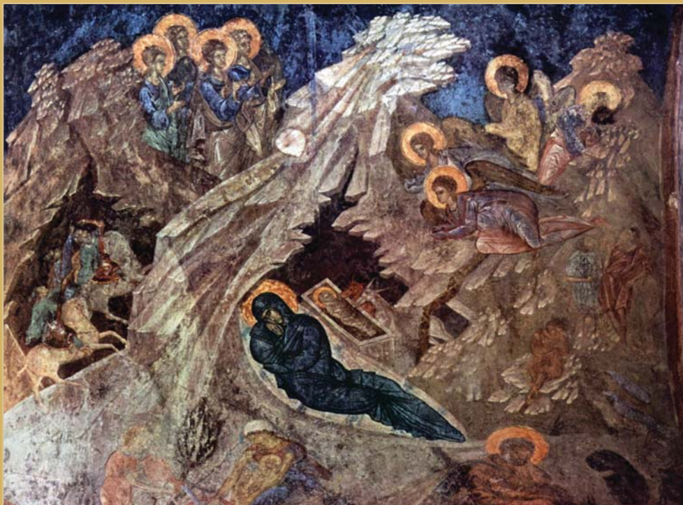
«Η Γέννηση του Χριστού». Τοιχογραφία Περιβλέπτου Μυστρά.

Του Αναστασίου, Αρχιεπισκόπου Τιράνων και πάσης Αλβανίας (+2025)