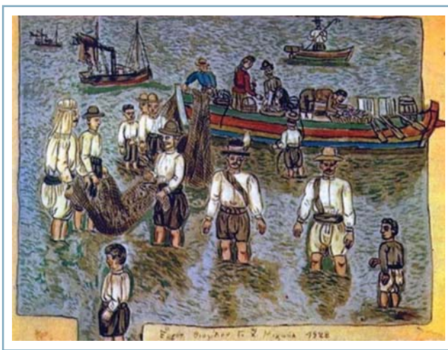
Θεόφιλος Χατζημιχαήλ, Το ψάρεμα.

Η περιοχή του Μεσολογγίου για πρώτη φορά μελετήθηκε από τον Άγγλο ορνιθολόγο Simpson το 1859. Το 1860 σε άρθρο του στο επιστημονικό περιοδικό Ibis, περιγράφει με ιδιαίτερη λεπτομέρεια το οικοσύστημα εκείνης της εποχής. «Τα δύο μεγάλα ποτάμια της δυτικής Ελλάδας, ο Ασπροπόταμος και ο Φίδαρης, τα οποία αποστραγγίζουν τα υψίπεδα της Αιτωλίας και ενός μέρους της Ηπείρου, τελικά αναδύονται από τα βουνά, στις δύο άκρες της οροσειράς που στα αρχαία χρόνια καλούνταν Αράκυνθος... Οι αλυβιακές αποθέσεις αυτών των ποταμών, ιδιαίτερα του Ασπροπόταμου, του οποίου ο όγκος νερού που διαθέτει είναι τεράστιος, έχουν δημιουργήσει με την πάροδο των αιώνων μια εκτεταμένη έκταση από βάλτους, που αποτελούν την νοτιοδυτική γωνιά της ηπειρωτικής Ελλάδας. Αυτή η περιοχή είναι ανόμοια χωρισμένη από τη μεγάλη λιμνοθάλασσα του Μεσολογγίου, η οποία έχει μέσο βάθος λιγότερο από τέσσερα πόδια... Η λιμνοθάλασσα είναι κατάσπαρτη από μικρά λασπώδη νησάκια, ενώ προστατεύεται από την ανοικτή θάλασσα από μια αμμώδη λωρίδα μήκους πολλών μιλίων. Προς την ανατολή, εκεί που βρίσκονται οι ορνέοσπαρτες πλαγίες του βουνού Βαράσοβα, που σηματοδοτούν τα όρια αυτής της περιοχής προς