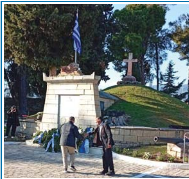
12-4-25 Κατάθεση στεφάνου στο μνημείο των αθανάτων νεκρών της Εξόδου