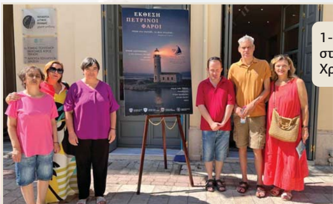
1-7-2025 Επίσκεψη των νέων που διαμένουν στη Στέγη μας στο Μεσολόγγι, στην έκθεση «Πέτρινοι Φάροι», στο Κτίριο Χρυσόγελου, στο Μεσολόγγι.