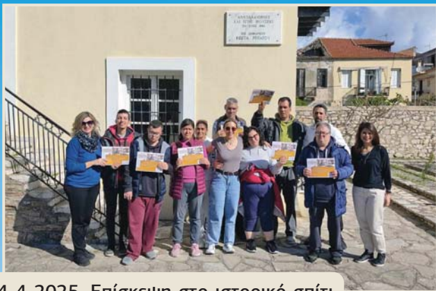
4-4-2025. Επίσκεψη στο ιστορικό σπίτι του Χαρίλαου Τρικούπη στο Μεσολόγγι.