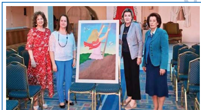
Ευχαριστούμε θερμά τη ζωγράφο κα Ευαγγελία Καρατάσου, η οποία προσέφερε έναν υπέροχο πίνακα ζωγραφικής με τίτλο «Και εγώ θα ζήσω» που φιλοτέχνησε (Λάδι σε καμβά).