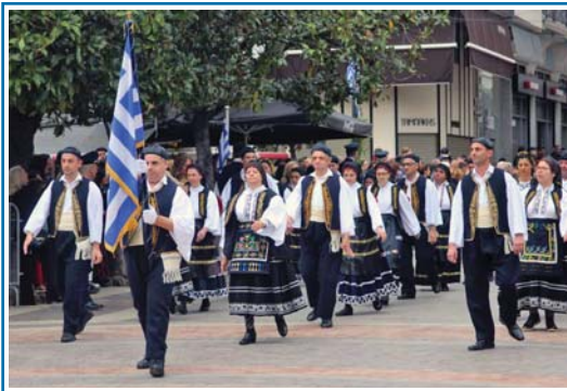
25η Μαρτίου 2024 στο Αγρίνιο

Με ιδιαίτερη χαρά και συναίσθηση πατριωτικού χρέους οι νέοι μας συμμετέχουν στις εθνικές παρελάσεις. Στην εθνική επέτειο της 25ης Μαρτίου, παρήλασαν στο Αγρίνιο, ενώ των Βαΐων συμμετείχαν στις γιορτές Εξόδου στο Μεσολόγγι.