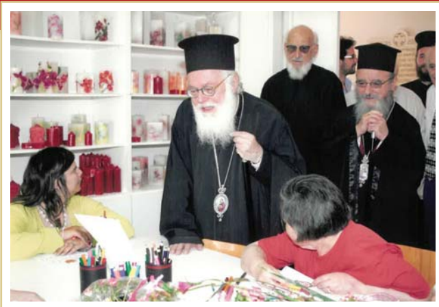
Ο Αρχιεπίσκοπος Αναστάσιος στο Εργαστήρι.

Εργάστηκε ερευνητικά στην Ουγκάντα, στην Κένυα, στη Νιγηρία, στο Καμερούν, τη Γκάνα, την Τανζανία. Και όπως συμβαίνει στις μεγάλες αποφάσεις, προβάλλει έντονο και το δίλημμα της ορθότητας της στιγμής του μεγάλου ναι. «Σε ώρες έντονων περισυλλογής αντιμετώπιζα το δίλημμα να μείνω στην Ελλάδα στο περιβάλλον που τόσο αγαπούσα και με αγαπούσε ή να φύγω για την Αφρική;