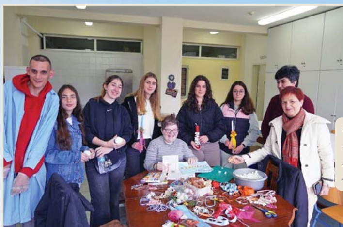
9-4-2025. Εκπαιδευτική διάδραση των νέων μας στην Β΄ Εκπαιδευτική Μονάδα στο Αργίτιο με το Λύκειο Αμφιλοχίας για τη δημιουργία πασχαλινών λαμπάδων και άλλων καλλιτεχνικών δημιουργιών.