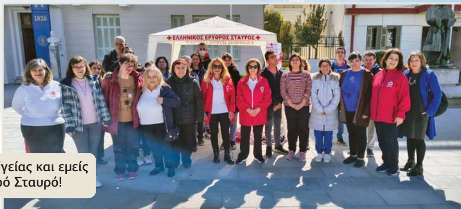
9-4-2025. Παγκόσμια ημέρα Υγείας και εμείς είμαστε εκεί μαζί με τον Ερυθρό Σταυρό!