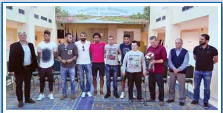
Ομάδα παικτών & στελεχών του Πανατωλικού στη Β' Εκπαιδευτική Μονάδα στο Αργίνο.