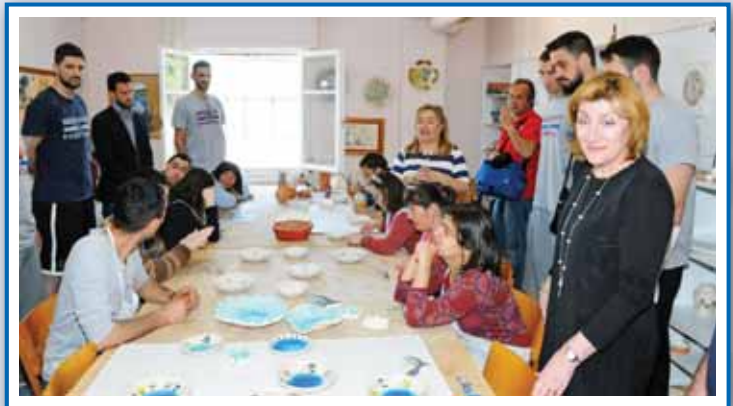
Ο Γυμναστικός Σύλλογος ΧΑΡΙΛΑΟΣ ΤΡΙΚΟΥΠΗΣ» στην Α' Εκπαιδευτική Μονάδα στο Μεσολόγγι.

Το Εργαστήρι «ΠΑΝΑΓΙΑ ΕΛΕΟΥΣΑ» ευχαριστεί θερμότητα και εύχεται Υγεία, Δύναμη και πάντα Επιτυχίες στην ομάδα «ΧΑΡΙΛΑΟΣ ΤΡΙΚΟΥΠΗΣ».