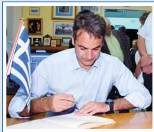
Ο Κυριάκος Μητσοτάκης στην Β' Εκπαιδευτική Μονάδα.

Τον κ. Μητσοτάκη συνόδευαν οι βουλευτές του νομού κ. Μάριος Σαλιμάς, κ. Κώστας Καραγκούνης, ο πρώην Βουλευτής κ. Σπήλιος Λιβανός, ο Πρόεδρος της ΝΟΔΕ Αιτωλοακαρνανίας της Νέας Δημοκρατίας κ. Φώτης Τσόλλας καθώς και πολίτευτές του νομού.