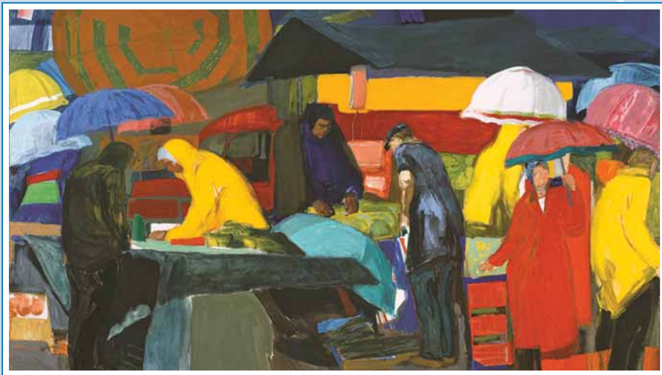
Λαϊκή Αγορά. Τέμπρα σε μουσαμά 249x405 εκ. 1979-82. Συλλογή Εθνικής Πινακοθήκης.

όλη τη χώρα (μεταξύ των οποίων στο Μεσολόγγι και Αγρίνιο) ασχολείται με τη χαρακτηριστική, την εικονογράφηση ναών και δημοσίων κτιρίων.