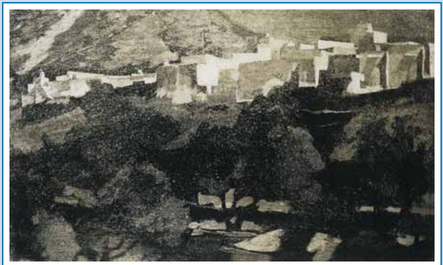
Σίφνος. Χαλκογραφία 30x49 εκ. 1972. Συλλογή Εθνικής Πινακοθήκης.

Το 1993 εκλέγεται τακτικό μέλος της Ακαδημίας Αθηνών. Έξι χρόνια αργότερα τού απονέμεται ο Ανώτερος Ταξίαρχος του Φοίνικος και γίνεται αναδρομική έκθεση στην Εθνική Πινακοθήκη. Παράλληλα όλα αυτά τα χρόνια εκθέτει σε διάφορες Μπιενάλε του εξωτερικού ως εκπρόσωπος της Ελλάδος, παρουσιάζει τα έργα του σε δεκάδες εκθέσεις σε