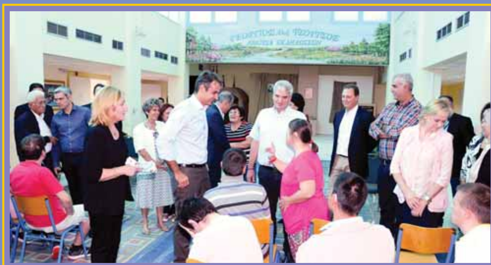
Από την επίσκεψη του κ. Κυριάκου Μητσοτάκη στη Β' Εκπαιδευτική Μονάδα στο Αγρίνιο.