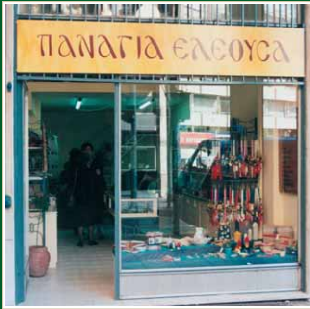
Εκθετήριο "ΠΑΝΑΓΙΑ ΕΛΕΟΥΣΑ" στο Αγρίνιο έναντι του Δημαρχείου Αγρινίου