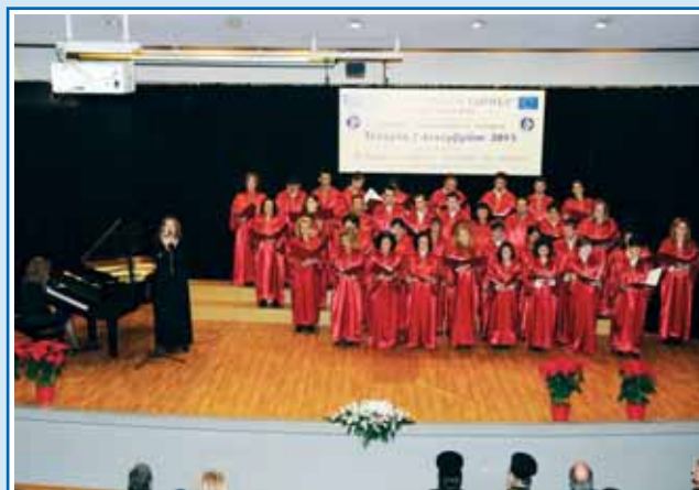
Η Χορωδία των Εκπαιδευομένων Νέων του Εργαστηρίου «ΠΑΝΑΓΙΑ ΕΛΕΟΥΣΑ».