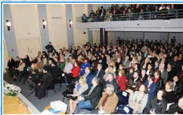
Από την εκδήλωση της 2ας Δεκεμβρίου 2015 στο Παπαστράτειο Μέγαρο.

Τη συζήτηση συντόνισε ο έγκριτος δημοσιογράφος κ. Παντελής Σαββίδης , βραβευμένος με το βραβείο ΜΠΟΤΣΗ και δημιουργός της διάσημης εκπομπής της ET3 « ΑΝΙΧΝΕΥΣΕΙΣ. »