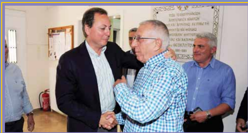
Από την επίσκεψη του κ. Νικήτα Κακλαμάνη στην Α' Εκπαιδευτική Μονάδα στο Μεσολόγγι.