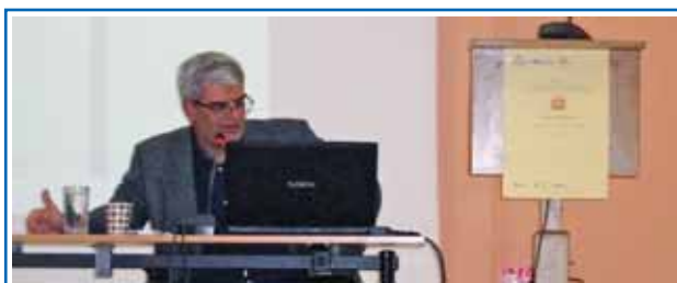
Ο Διευθυντής του Εργαστηρίου «ΠΑΝΑΓΙΑ ΕΛΕΟΥΣΑ» ως ομιλητής στην Ημερίδα του ΕΚΚΑ.