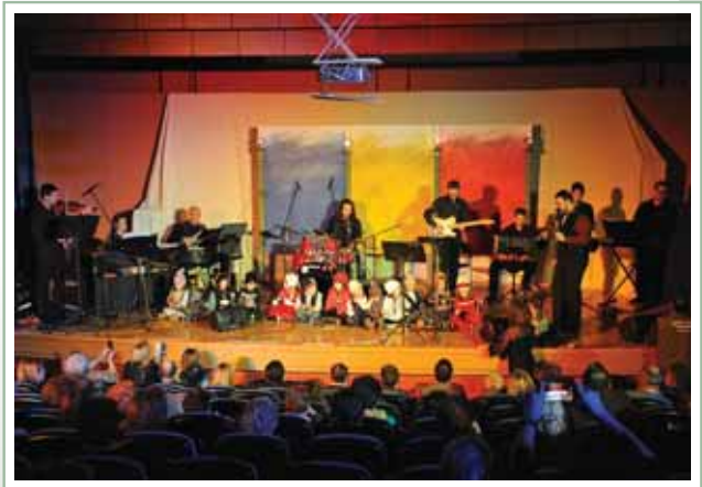
Από την Χριστουγεννιάτικη γιορτή στο Μεσολόγγι.