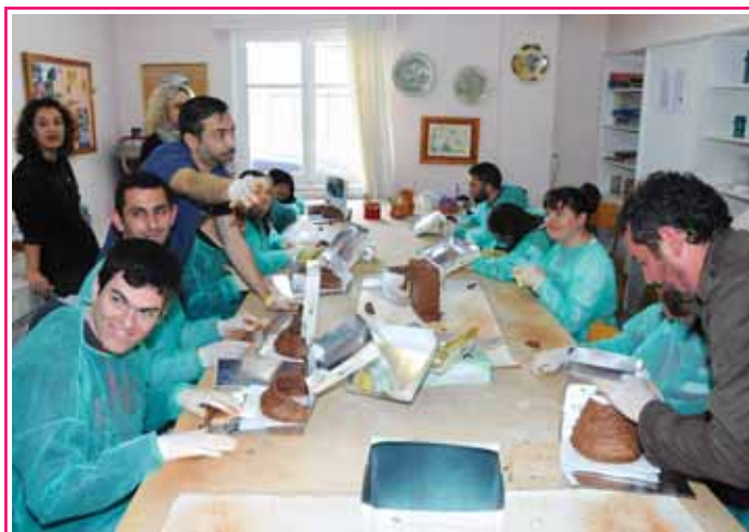
Η Ορνιθολογική εταιρεία με τους νέους μας κατασκευάζουν φωλιές.

Τη Δευτέρα 21 Μαρτίου 2016, στην Α΄ Εκπαιδευτική Μονάδα του Εργαστηρίου «ΠΑΝΑΓΙΑ ΕΛΕΟΥΣΑ» στο Μεσολόγγι, πραγματοποιήθηκε μια πολύ σπουδαία και καινοτόμα δράση . Η Ελληνική Ορνιθολογική Εταιρεία και ο Φορέας Διαχείρισης Λιμνοθάλασσας Μεσολογγίου είχαν την εξαιρετική πρωτοβουλία να επιλέξουν το Εργαστήρι «ΠΑΝΑΓΙΑ ΕΛΕΟΥΣΑ» και συγκεκριμένα το τμήμα Κεραμικής για την κατασκευή πήλινων φωλιών για τα χελιδόνια. Στα πλαίσια της δράσης αυτής, εκπρόσωποι των Ορνιθοπαρατηρητών Μεσολογγίου και στελέχη του Φορέα Διαχείρισης Λιμνοθάλασσας Μεσολογγίου επισκέφθηκαν το Εργαστήρι μας στο Μεσολόγγι και αφού έγινε μια παρουσίαση σε βίντεο με τίτλο «Τα Χελιδόνια της Ελλάδος» και μια προβολή φωτογραφιών από τα πουλιά του Εθνικού Πάρκου. Στη συνέχεια οι εκπαιδευόμενοι νέοι του τμήματος Κεραμικής του Εργαστηρίου «ΠΑΝΑΓΙΑ ΕΛΕΟΥΣΑ» κατασκεύασαν με πηλό από μία χελιδονοφωλιά ο καθένας. Οι φωλιές αυτές τοποθετήθηκαν στο Ναυταθλητικό Κέντρο του Εργαστηρίου μας που βρίσκεται στο Λιμάνι Μεσολογγίου.