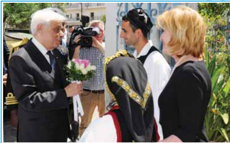
Η υποδοχή του Προέδρου της Ελληνικής Δημοκρατίας κ. Προκόπη Παυλόπουλου στην Α' Εκπαιδευτική Μονάδα στο Μεσολόγγι.

Το Εργαστήρι «ΠΑΝΑΓΙΑ ΕΛΕΟΥΣΑ» ευχαριστεί θερμότατα τον Εξοχώτατο Πρόεδρο της Δημοκρατίας κ. Προκόπη Παυλόπουλο, για την υψηλή τιμή και το κύρος που προσέδωσε στο φορέα μας με την επίσκεψή του, η οποία θα καταγραφεί στην ιστορία του.