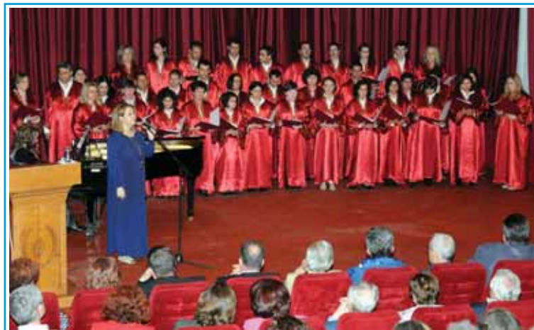
Η Χορωδία των Εκπαιδευμένων Νέων του Εργαστηρίου «ΠΑΝΑΓΙΑ ΕΛΕΟΥΣΑ».