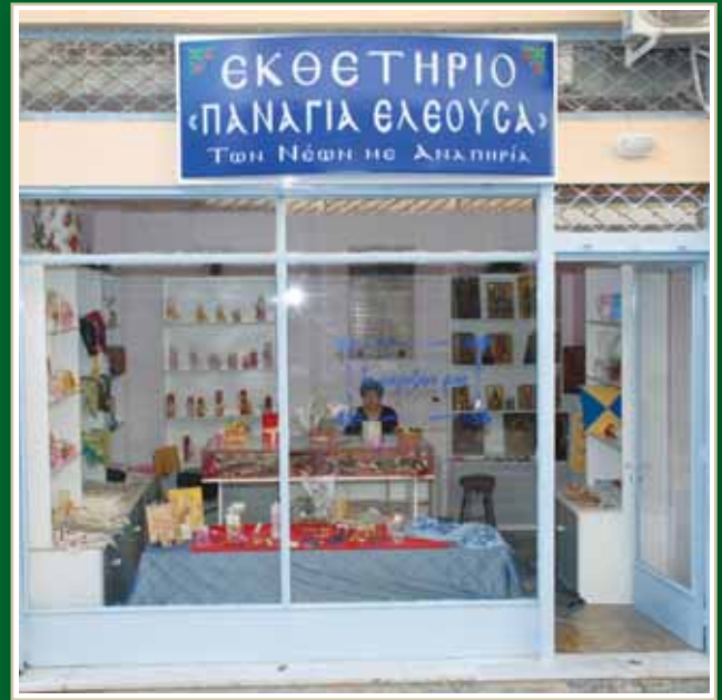
Εκθετήριο "ΠΑΝΑΓΙΑ ΕΛΕΟΥΣΑ" στο Μεσολόγγι, προσφορά του Δροσινείου Ιδρύματος και της Ιεράς Μητροπόλεως Αιτωλίας & Ακαρνανίας