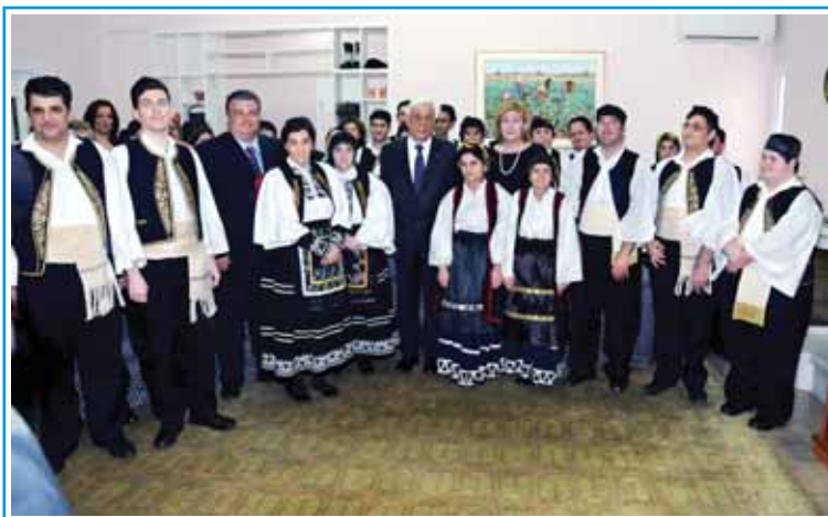
Από την επίσκεψη του Προέδρου της Ελληνικής Δημοκρατίας στην Α' Εκπαιδευτική Μονάδα.