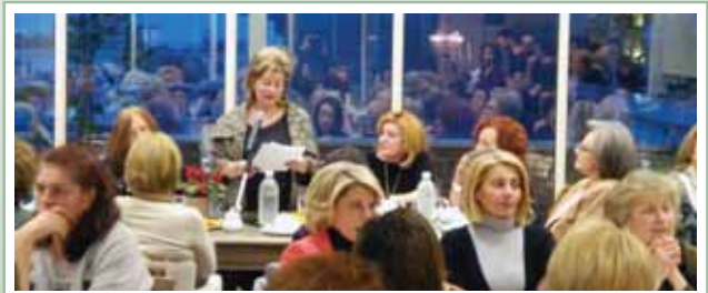
Από την Γενική Συνέλευση και κοπή πίτας του Συλλόγου Εθελοντών.