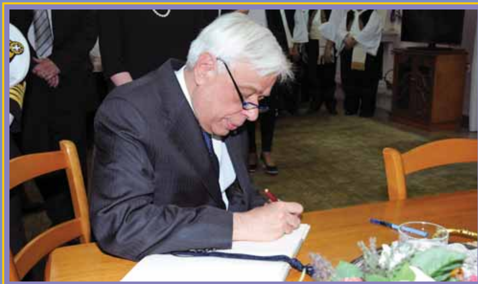
Ο Πρόεδρος της Ελληνικής Δημοκρατίας κ. Προκόπης Παυλόπουλος στην Α' Εκπαιδευτική Μονάδα στο Μεσολόγγι.