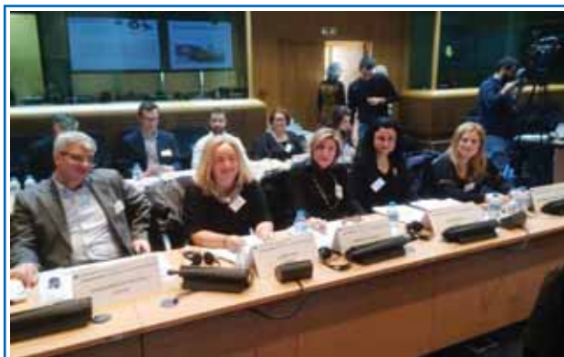
Η ομάδα του Εργαστηρίου «ΠΑΝΑΓΙΑ ΕΛΕΟΥΣΑ» στο συνέδριο CEDEFOP.

Συνέδριο του Cedefop με θέμα «Η επίδραση της παγκοσμιοποίησης στους φορείς που παρέχουν επαγγελματική κατάρτιση - δυσκολίες και ευκαιρίες» διεξήχθη στις 26 και 27 Νοεμβρίου 2015, στην πόλη της Θεσσαλονίκης. Συμμετείχαν διακεκριμένοι ομιλητές και πραγματοποιήθηκαν ενδιαφέροντα θέματα. Η συμμετοχή μας στο Συνέδριο του Cedefop, αποτέλεσε μια πολύτιμη εμπειρία, καθώς παράλληλα με το Συνέδριο, μας δόθηκε η δυνατότητα να γνωρίσουμε εκπροσώπους άλλων Ευρωπαϊκών φορέων και να ανταλλάξουμε απόψεις σε θέματα προώθησης κατάλληλων συστημάτων επαγγελματικής εκπαίδευσης και κατάρτισης.