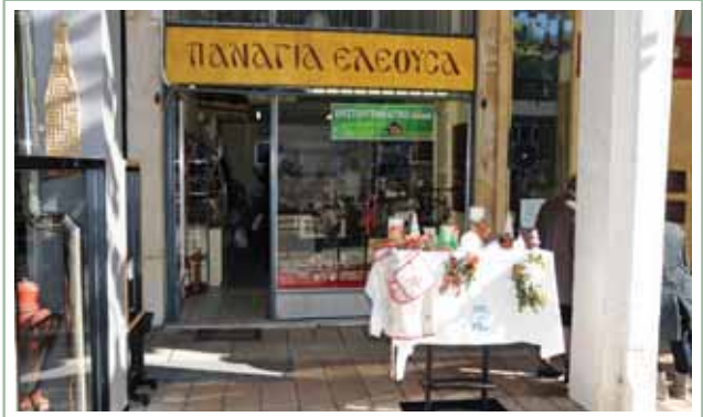
Χριστουγεννιάτικο bazaar στο μαγαζάκι μας στο Αργίριο.

Ο Σύλλογος «Φίλων, Γονέων & Εθελοντών» εύχεται «Καλή Χριστούγεννα και Ευτυχισμένο το Νέο Έτος».