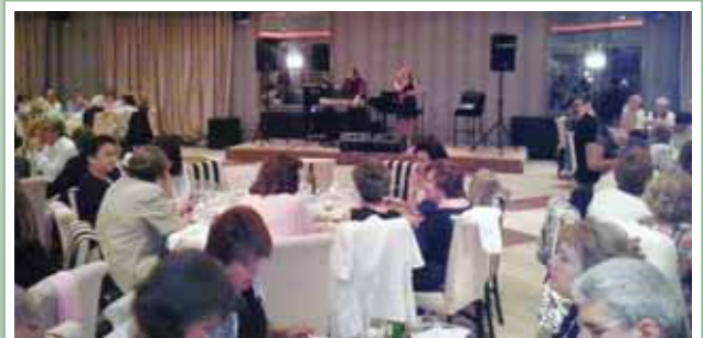
Από το «Δείπνο αγάπης» του Εργαστηρίου «ΠΑΝΑΓΙΑ ΕΛΕΟΥΣΑ».