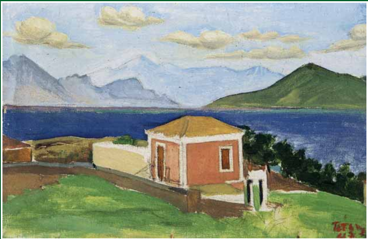
Π. Τέτοσης «Σπίτι στην παραλία»

Σ' αυτό τον κόσμο, που ολοένα στενεύει, ο καθένας μας χρειάζεται όλο και τους άβλους. Πρέπει να αναζητήσουμε τον άνθρωπο, όπου και αν βρίσκεται. Γ. Σεφέρης