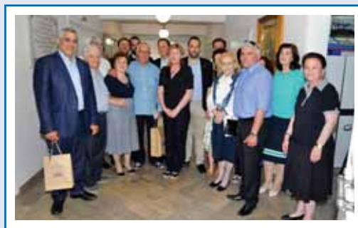
Από την επίσκεψη του κ. Νικήτα Κακλαμάνη στην Α' Εκπαιδευτική Μονάδα στο Μεσολόγγι.

Ο κ. Κακλαμάνης ενημερώθηκε για την πορεία του Εργαστηρίου και υπογράμμισε το ιδιαίτερο ενδιαφέρον του για τη λειτουργία του διαβεβαιώνοντας ότι θα συμπαρίσταται ως φίλος στον αγώνα που δίνει ο φορέας για τα άτομα με την πληγωμένη νοημοσύνη.